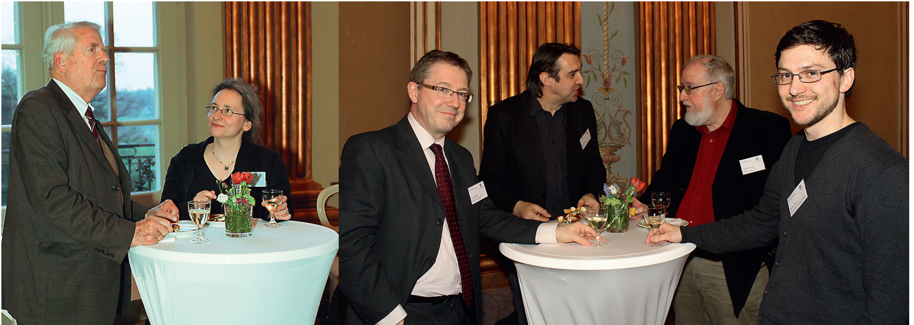
Braunschweig, reception at Richmond Palace.

Die Konferenz endete in der Villa Seligmann in Hannover, wo Gelegenheit zur Besichtigung des Gebäudes und der Bet Tfila-Ausstellung zu Reformsynagogen bestand, die hier noch bis zum 15. Juni 2014 zu sehen ist.