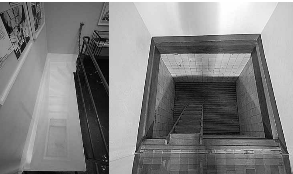
Mikwen als Teil von Ausstellungen im August-Gottschalk-Haus in Esens (l) und im Komplex des Jüdischen Museums in Rendsburg /Mikva'ot as part of exhibitions at the August-Gottschalk-Haus in Esens (l) and at the Jewish Museum in Rendsburg.