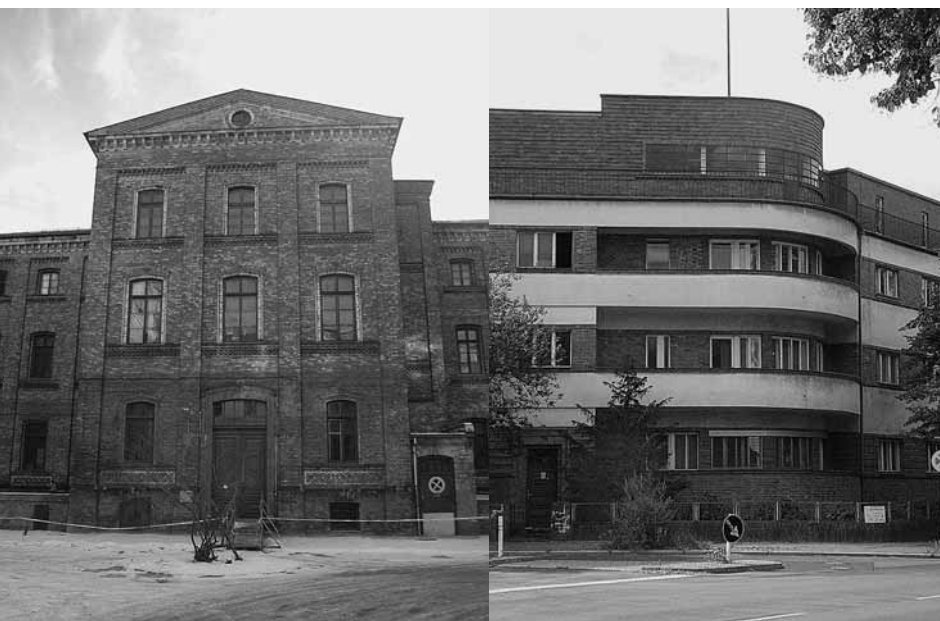
l: Berlin, Krankenhaus Auguststraße (1859–61), Eingangsfassade, Arch. E. Knoblauch/Berlin, hospital Auguststraße (1859–61), arch. E. Knoblauch, entrance façade.

This project, carried out during a three year period between 2006 and 2009, enabled us to collect information on about 1,650 objects (ritual buildings, schools, welfare institutions, offices, etc.) in our Bet Tfila database of Jewish architecture in Europe. Many libraries and archives in Berlin, Jerusalem, and Tel Aviv were consulted, but due to the vast amount of objects, we were unable to complete our the research during the first part of our project. With the help of the additional funding, we will be able to prepare a manuscript containing a comprehensive catalogue of all objects along with introductory articles.