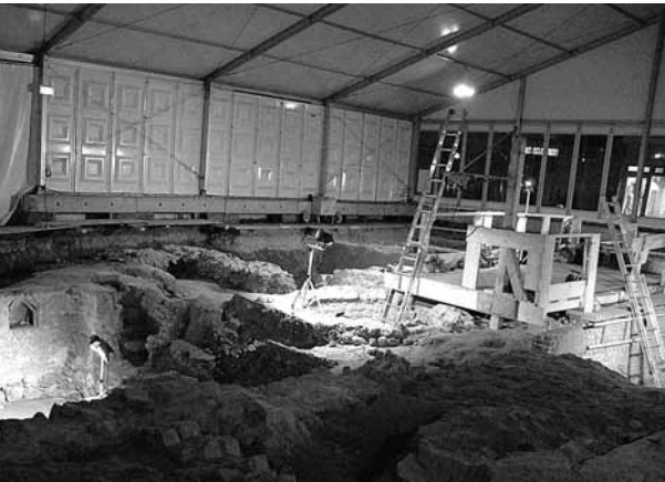
Die Archäologische Zone Köln während der Grabungsarbeiten/Archaeological Zone Cologne during the excavation.