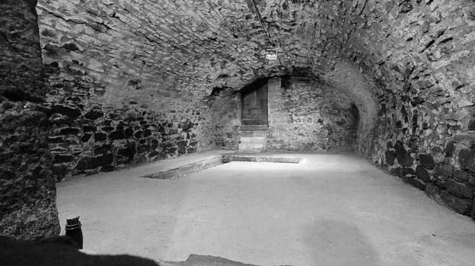
Hannoversch-Münden, Hinter der Stadtmauer 23, wiederentdeckte Mikwe (vermutlich Ende des 18. Jb.) mit Tauchbecken/Hannoversch-Münden, 23 Hinter der Stadtmauer, recovered mikveh with basin (most probably dating from the end of the eighteenth century) (M. Przystawik, 2009).

Bereits seit den ersten Projekten hat sich die Arbeit der Bet Tfila nicht nur auf Synagogenbauten konzentriert sondern auch immer andere jüdische Ritualbauten mit eingeschlossen. In den vergangenen 15 Jahren konnten ca. 450 Mikwen in Deutschland und Europa mit ihren Grunddaten erfasst werden. Einzelne Publikationen zu jüdischen Ritualbädern sind in unseren Kleinen Schriften „Die Bauwerke der jüdischen Gemeinden in Schwedt/Oder“ und „Beiträge zur jüdischen Architektur in Berlin“ veröffentlicht.