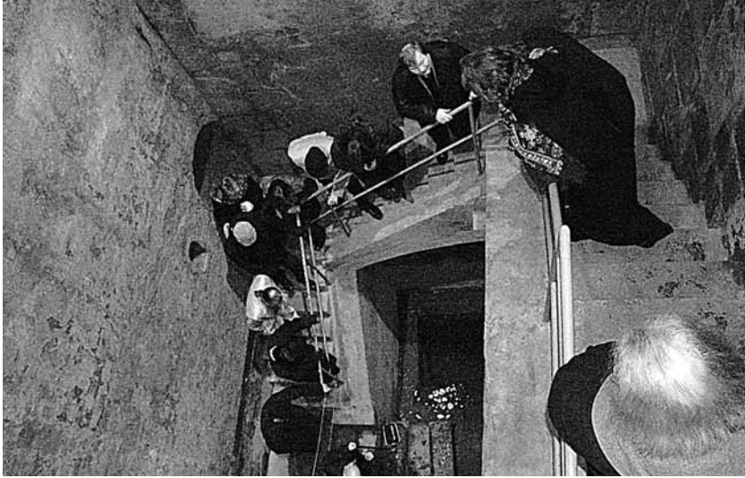
Teilnehmer des Workshops bei der Besichtigung der Grabungsstätte/Participants of the workshop visiting the excavation site.

Synagoge und nachmaligen Ratskapelle Mitte der 1950er Jahre freilegte, einen Nutzungsbeginn der Synagoge zumindest im 9. Jahrhundert nicht ausschließen wollen.